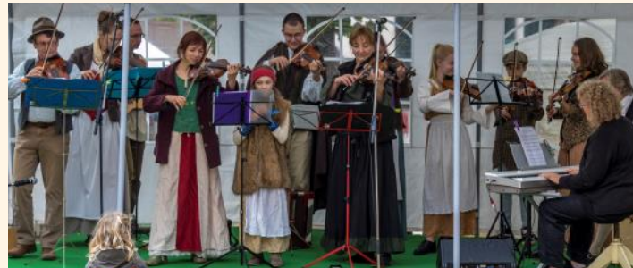
Dorffiedler aus Güldengossa